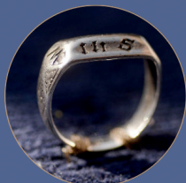
L'anneau de Jeanne d'Arc est la propriété du Puy du Fou